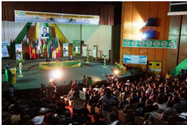
Ouverture des 3es Rencontres Afrique Europe des huissiers de justice

Les 26 et 27 septembre 2013 se sont tenues à Lomé (Togo) les troisièmes Rencontres Afrique Europe des huissiers de justice en présence du ministre de la justice du Togo et des plus grandes institutions et organisations internationales. Les points phare de la manifestation ont été la célébration des 20 ans de l'Ohada et la présentation des travaux de l'UIHJ sur le Code mondial de l'exécution.