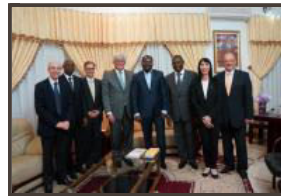
La délégation de l'UIHJ avec Kwesi Séléagodjil Ahoomey-Zunu, Premier ministre du Togo