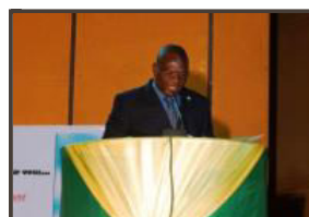
André Sama Botcho, président de la Chambre nationale des huissiers de justice du Togo