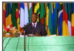
Koffi Esaw, ministre de la justice du Togo