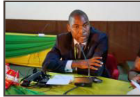
Alain Ngongang Sime, président de la Chambre nationale des huissiers de justice du Cameroun