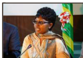
Yacine Sene (Sénégal), ancienne vice-présidente de l'UIHJ